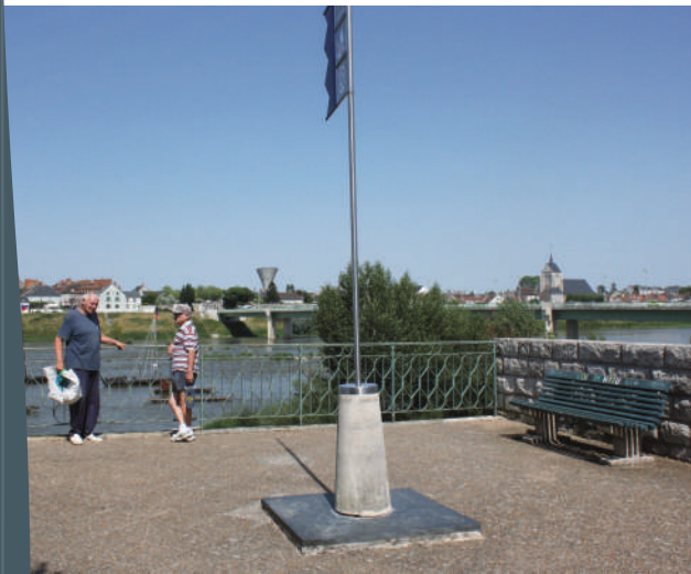
La Fabrique du Lieu

Il existe en bord de Loire des lieux invitant à une contemplation du fleuve : sites équipés de panneaux d'observations ou de tables de pique-nique, piles d'anciens ponts ou cales, terrasses de château... Les belvédères, aménagements spécialement destinés à l'observation de la Loire en hauteur, sont toutefois peu répandus. Ils présentent l'avantage d'inciter le visiteur à s'arrêter et à fixer son attention sur des vues emblématiques choisies, de patrimoine naturel ou bâti.