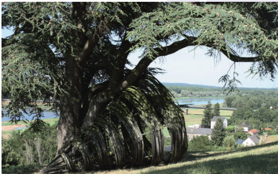
La Fabrique du Lieu