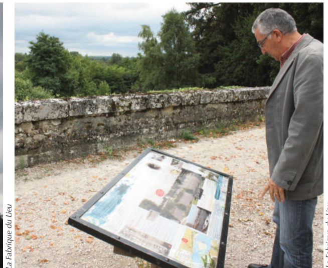
Exemples de signalétique sur le point de vue de Saint-Benoit-sur-Loire et de table de lecture à Beaugency