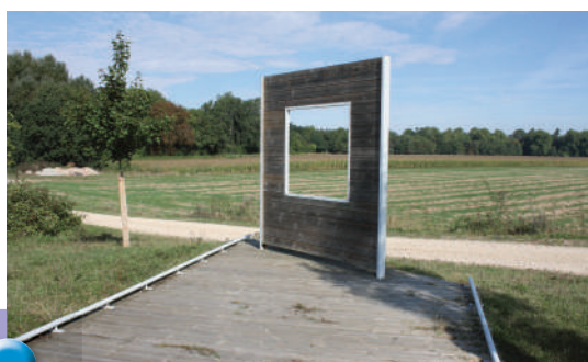
La Fabrique du Lieu

La commune de Châteauneuf-sur-Loire a expérimenté deux aménagements pour mettre en valeur son paysage : la réalisation d'un kiosque dans le parc du château pour observer la Loire et l'installation d'une fenêtre (photo) au niveau de la station d'épuration pour regarder le château. Ces deux installations témoignent de la volonté de mettre en scène les vues.