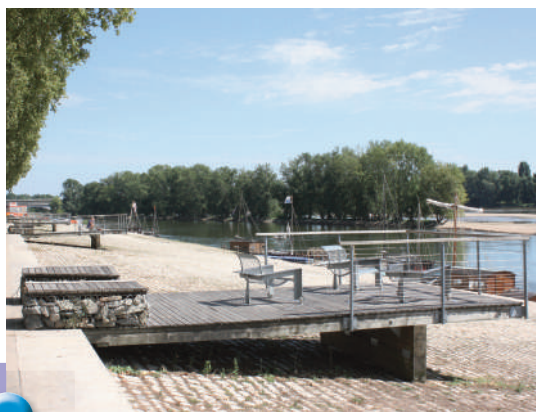
La Fabrique du Lieu

Dans le projet du paysagiste Michel Corajoud, quelques mini-belvédères ont été installés sur les quais. Même si la vue est similaire à celle située quelques mètres en arrière sur le cheminement piéton, la situation détachée du sol incite à s'arrêter en ce lieu. Par ailleurs, des assises originales parce que rotatives sont à la disposition des promeneurs. L'objet architectural est aussi une composante de l'aménagement d'ensemble par l'usage de gabions remplis de pierres locales et d'une structure métallique légère qui laisse le regard percevoir le paysage de fond.