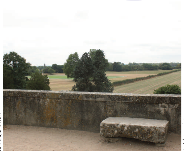
La Fabrique du Lieu