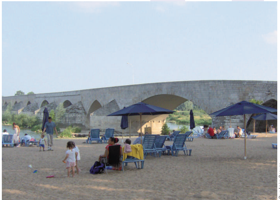
Feu d'artifice et plage à Beaugency