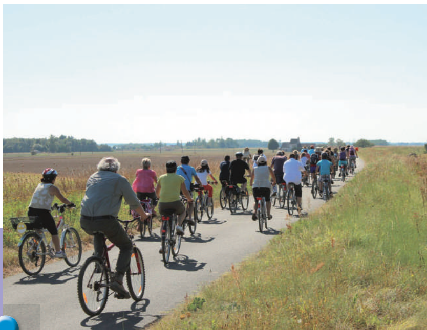
La Fabrique du Lieu

A retenir : un projet artistique à plusieurs dimensions pleinement ancré dans son cadre naturel. Un événement qui valorise le patrimoine ligérien dans une ambiance festive... tout en faisant du sport.